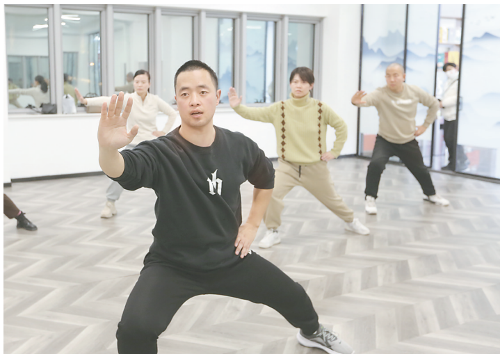
学员在人才夜校学习太极拳。

作各县（市、区）的特色美食，在小剧场里一展歌喉，到室外集体拔河，最后还能赢得各种奖品……这些，都让来这里的青年感动备受宠爱。 白天上班，晚上学艺，就来焦作人才之家。2月26日，第一期焦作人才夜校复课，报名的青年人在焦作人才之家开启“夜生活”。不少学员说，选择报名参加人才夜校，一是学费非常低；二是增加技能，学一些小时候想学而没机会学的课，比如舞蹈课、书法课等；三是多学点看似“无用”的东西，提高人生质量，开启幸福模式。 焦作人才之家，越来越火，不管白天还是夜晚。