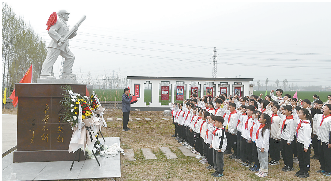
4月3日,西万镇留庄村李文彦烈士文化广场,少先队员在李文彦烈士雕像前宣誓。清明将至,各地干部群众通过形式多样的活动祭奠英烈,培育爱国情怀。

□沁声 “老吾老以及人之老”。让更多老年人共享改革发展成果、安享幸福美满晚年,不仅是百姓“小家”的愿景,更是社会“大家”的目标。 打造一批村级养老服务中心示范点,开工建设敬老院提升项目和幸福院示范点,完成乡镇综合养老服务中心提升改造工程和智慧养老服务平台建设,建设老年食堂示范点……养老服务是重要的民生工作,承载着无数家庭的期盼,作为沁阳市“四十工程”的十大民生工程,养老服务能力提升工程映照了“老吾老以及人之老”的情怀。 老龄化社会,老年人的生活需求在哪里,养老服务更应跟到哪里。相关社会调查显示,我国九成以上老年人向往居家养老。然而,现实情况却是事与愿违,相当一部分子女因工作压力大、生活压力无法全身心照顾老人,同时部分空巢、失独等老年人的养老服务需求更加迫切。 问题是工作的导向。我们要按照养老服务能力提升工程要求,在大力建设日间照料中心、农村幸福院等养老服务机构的的基础上,根据不同老年人的实际情况,进一步细化服务,努力打造老年人家门口的“幸福驿站”;要逐步形成“市乡村三级养老服务体系,打造‘城市15分钟、农村1公里养老服务圈’,不断满足老年人多样化需求,真正实现老有所养、老有所依、老有所乐、老有所安。 “老吾老以及人之老”,沁阳能做得更好!