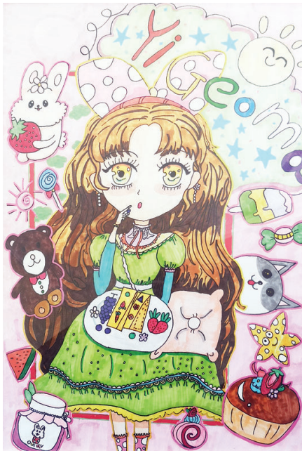
●马艺歌 hy2022125 环南一小二二班