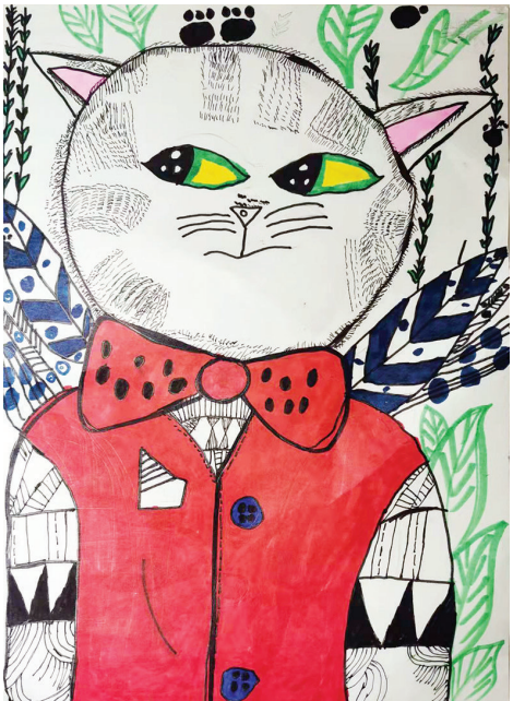
●牛星晨 hy2022153 环南一小二二班