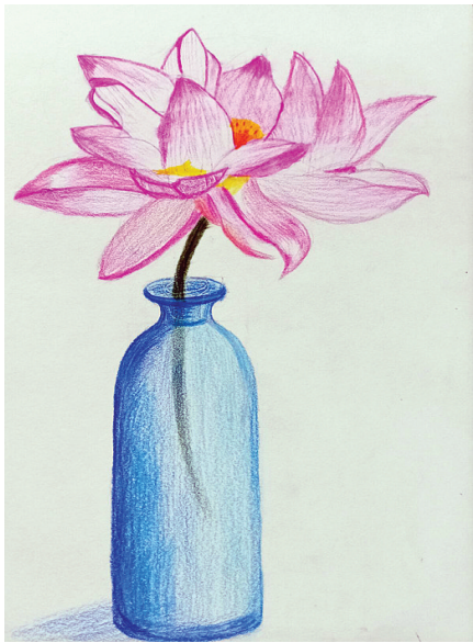
●贺文奇 gx2111002 马村工小二二班

今天老师讲到“衔”字,问道:“谁能用这个字组词?”我高高地举起手来,被老师点名后,我立马站了起来,脱口而出:“结草衔环。”老师欣慰地笑了,夸奖我读的书多,还让全班同学给我鼓掌。 面对老师的夸奖和同学的掌声,我的心里像吃了蜜一样甜。妈妈对我说:“老师夸奖的是刻苦读书的行为,同学的掌声是鼓给掌握知识的人的。”(指导老师:李素萍)