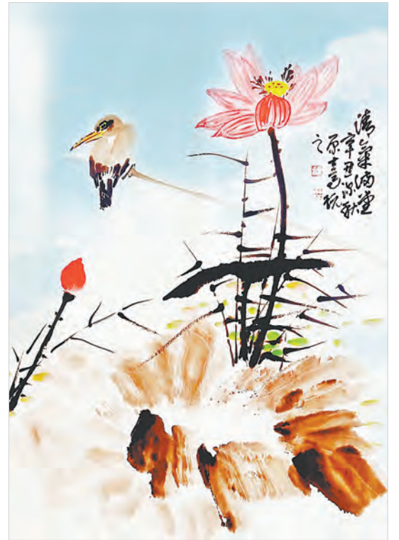
▶清气满堂(国画) 原士高 作