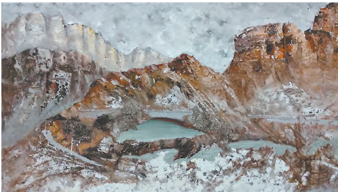
▲忆太行(油画) 任鹏龙 作