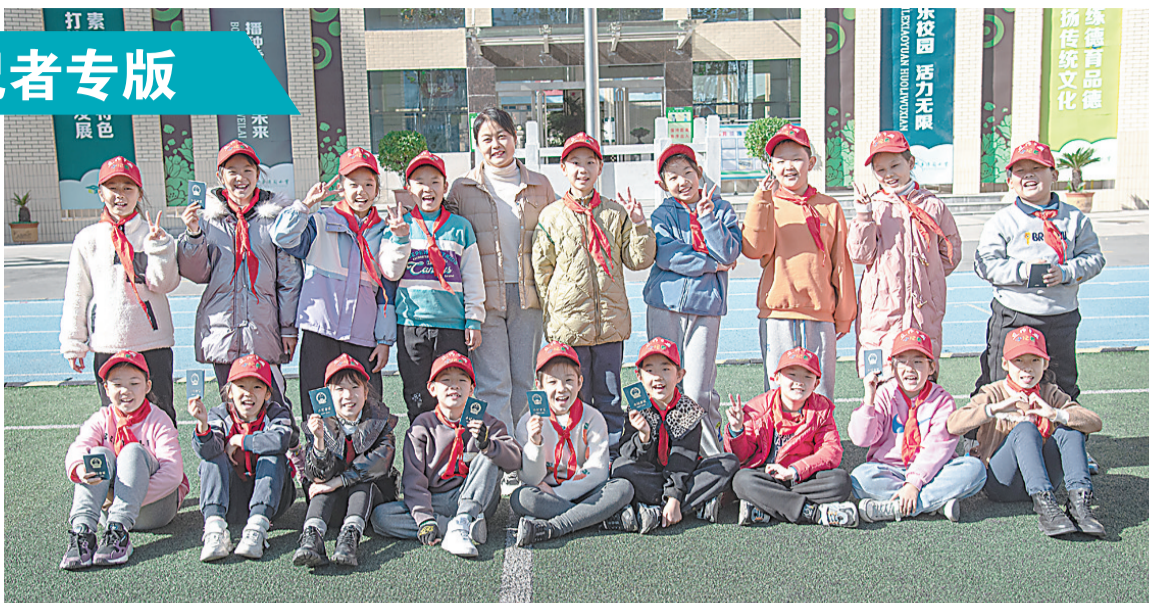
丰泽园小学四(5)班小记者和班主任合影。

书山路漫漫,以勤奋为首;学海苦茫茫,须刻苦当先。愿我们班的孩子们用理想和汗水编织青春多彩的生活,奏响时代旋律,与时俱进,让光芒闪耀在祖国的明天! 胡俊平