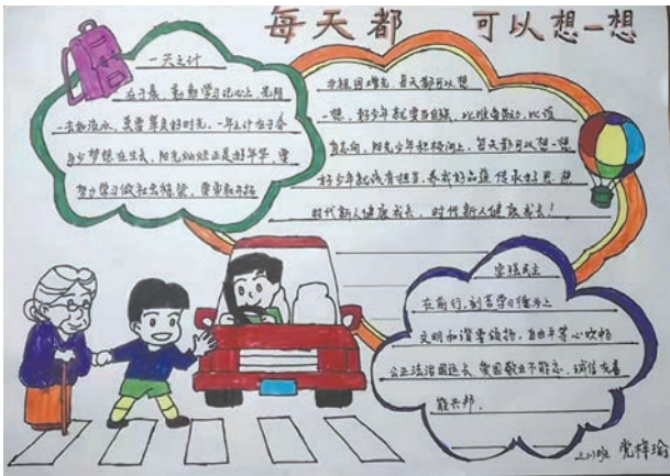
党梓瑜 tn2111090 塔南路小学三(1)班