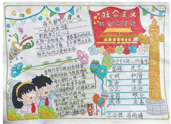
冯雨晴 tn2111096 塔南路小学三(2)班