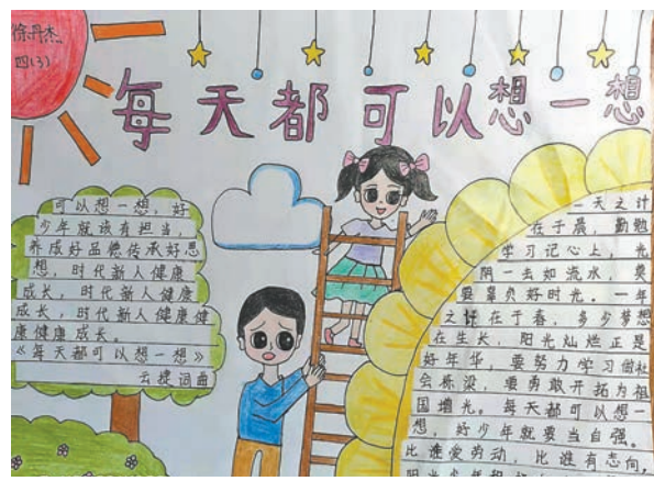
徐丹杰 tn2111056 塔南路小学四(3)班