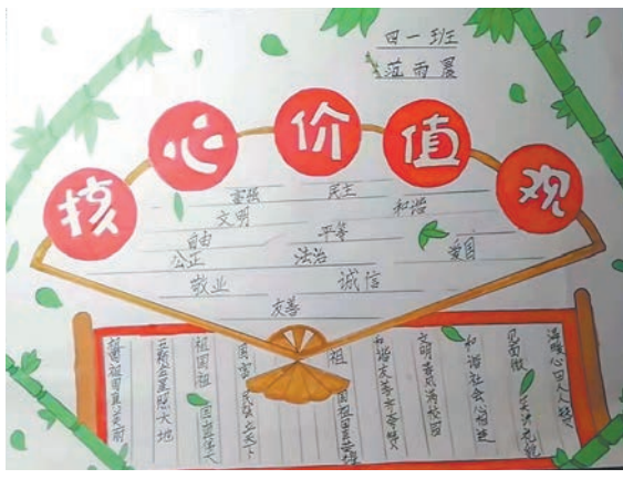
范雨晨 tn2111109 塔南路小学四(1)班