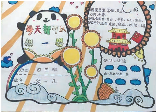
张一凡 tn2111099 塔南路小学四(4)班