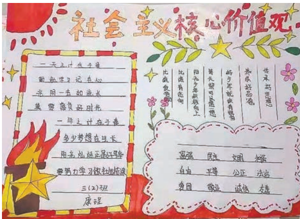
康 垚 tn2111103 塔南路小学三(2)班