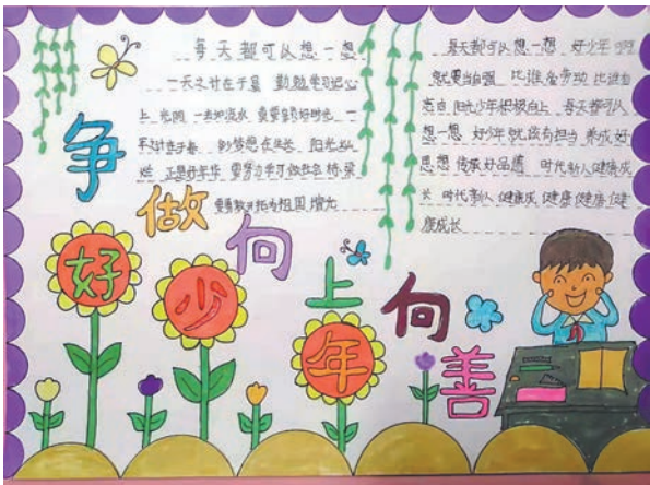
司博菡 tn2111067 塔南路小学四(4)班