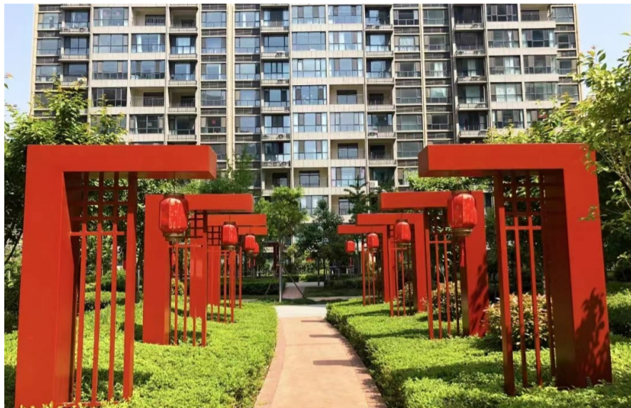
上图 金山·东方花园小区实景。