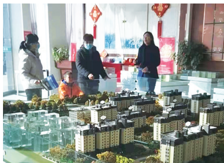
购房者了解璞玥府项目详情。

如果说浓厚的人文气息开启了孩子的心智成长,那么生态环境则给孩子营造了静谧读书的心境。有调查显示,生活在宁静、清幽环境中的孩子智力优秀、智商较高。相反,噪声充斥则是智力开发的障碍。未来,在璞玥府项目里你可以看到,幽雅宜人的环境、四季葱茏的草木、齐备的健身设施、环形的跑道、五人制的足球场、适宜的儿童玩耍设施以及人车分流制度等,均为孩子的生理成长方面提供了沃土,是品质服务、关爱孩子的人性化之举。