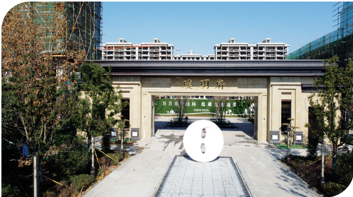
璞玥府南大门实景图。