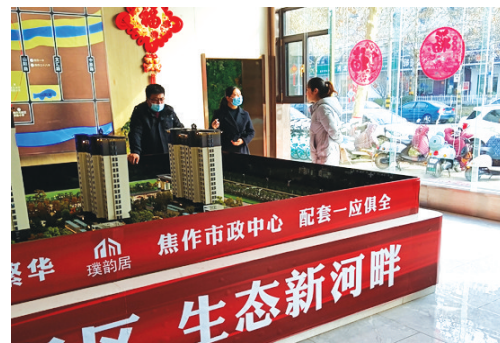
购房者了解房源详情。

目前,焦作的楼盘遍地开花,楼盘风格也各具特色,然而为什么那么多的置业者却看中了璞韵居?答案很简单,该项目地理位置优越,出门即是风景,在这里安家,舒适惬意、悠然自得。