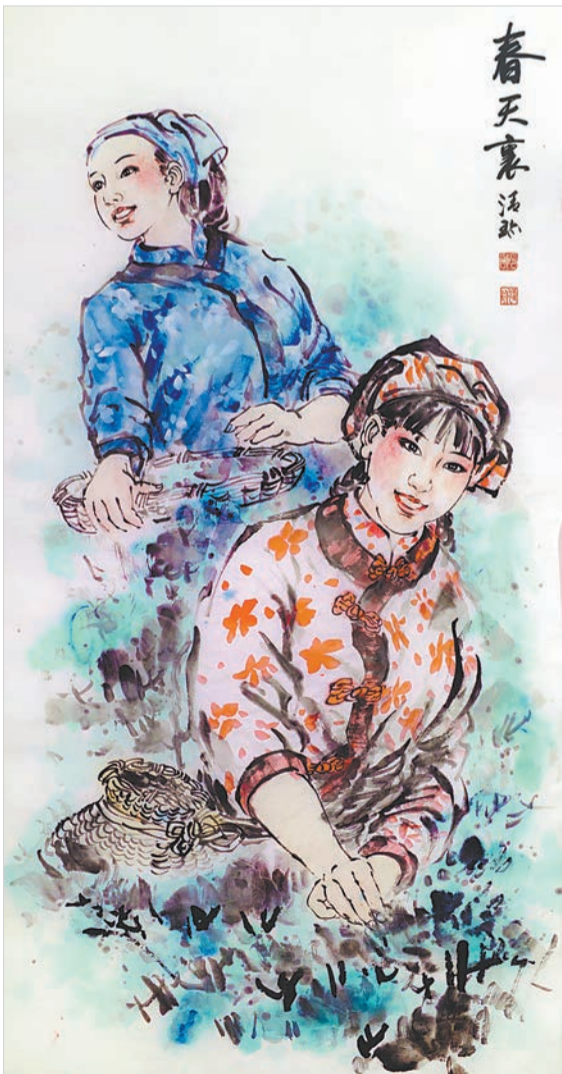
春天里(国画) 郑清珍 作