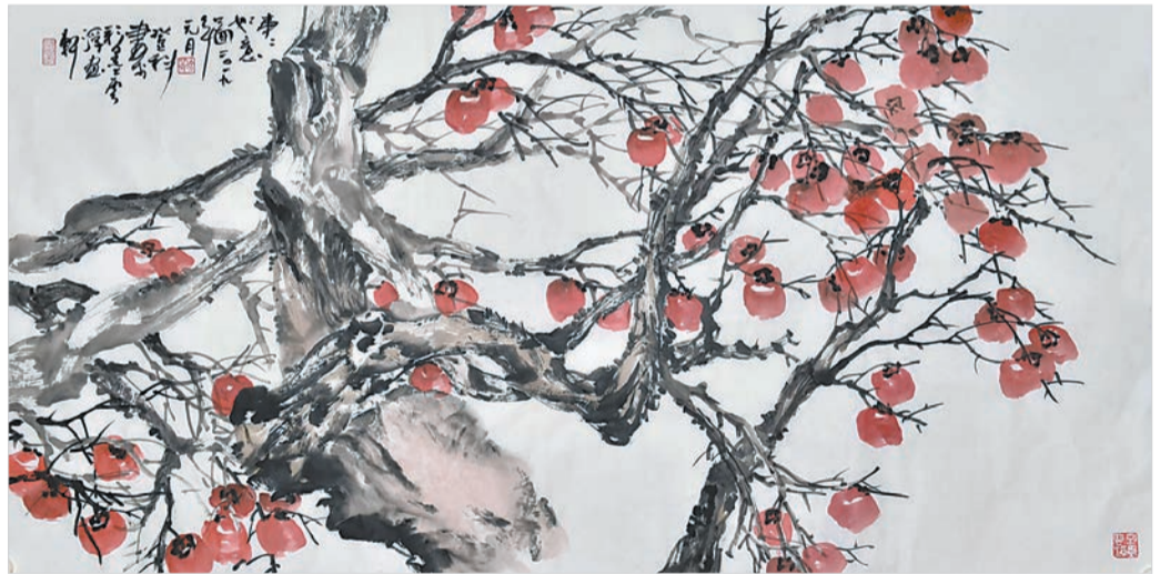
事事如意(国画) 徐登科 作