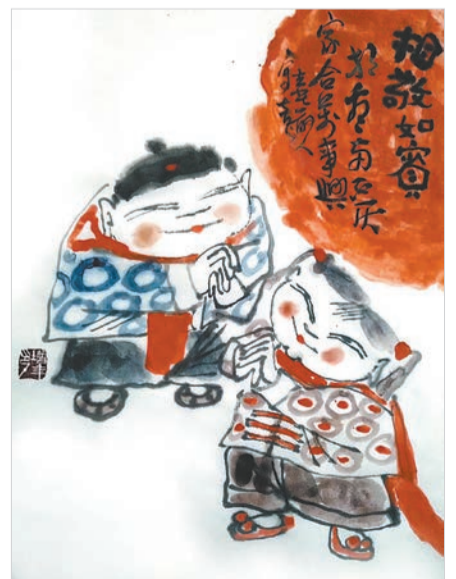
相敬如宾(国画) 卞增年 作