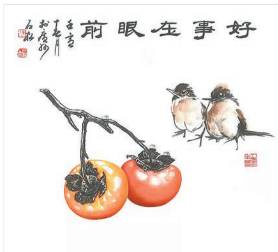
好事在眼前(国画) 陈石松 作