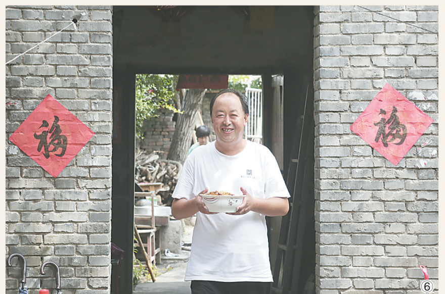
图⑥ 地锅炖烩菜,请你来品尝。