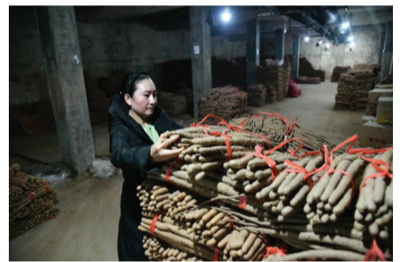
恒温库工作人员在整理货物。