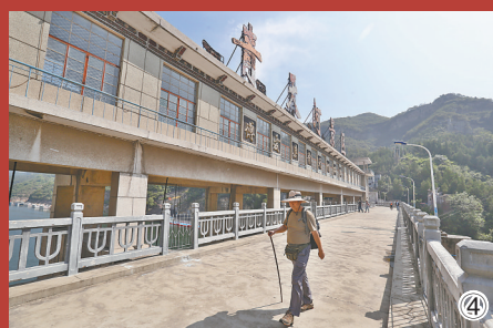
图① 青天河水库大坝。本报记者 吉亚南 摄 图② 青天河水库工程建设场景。（本报资料照片） 图③ 景区工作人员在介绍青天河水库大坝。本报记者 吉亚南 摄 图④ 游客在青天河水库大坝上观光。本报记者 吉亚南 摄