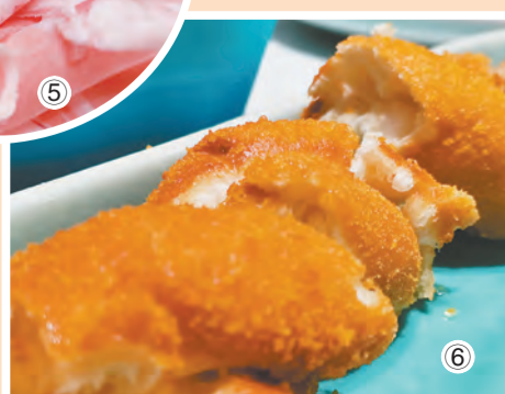
图① 焦作市新春首届特色美食餐饮展评现场。 图②③④⑤⑥ 鲜美的越秀海棠居火锅食材。