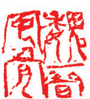
魏晋风骨(篆刻) 曹欢作