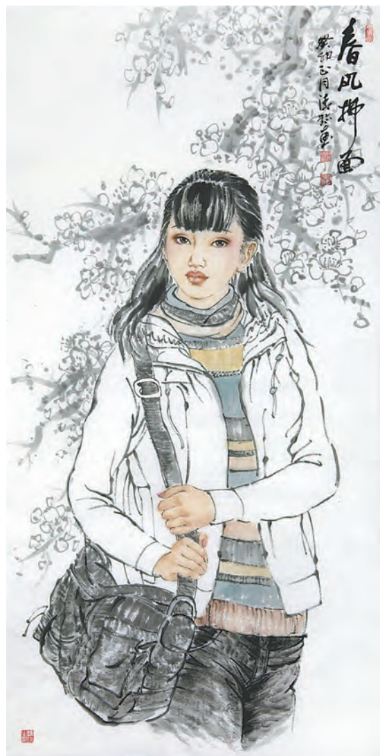
春风拂面(国画) 郑清珍 作