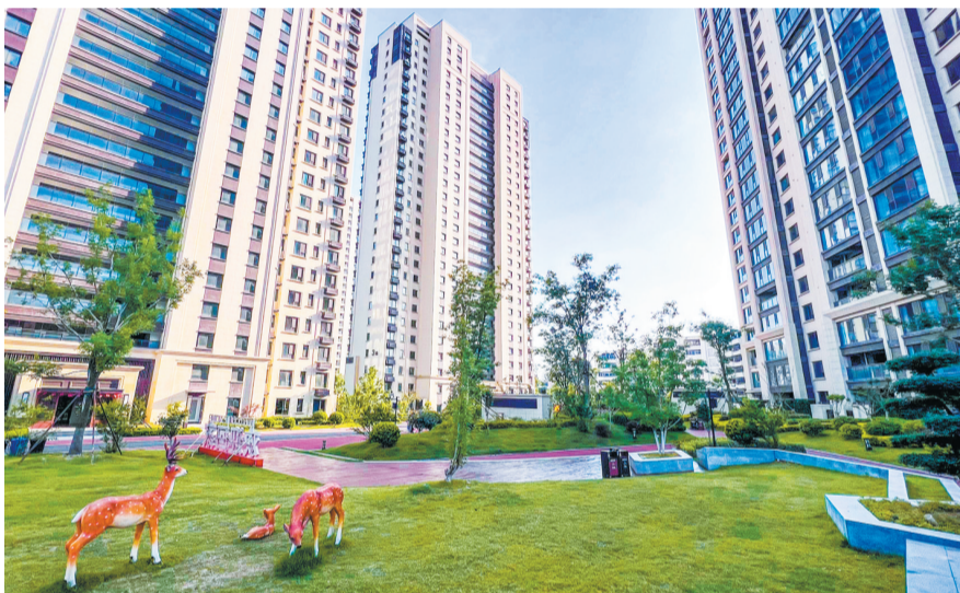
幽雅的小区环境。

南临解放路,北临太行路,入住于此的业主不管是开车还是乘坐公交车,基本上半个小时就可以通达全城。