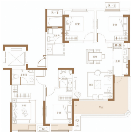
博园·澜庭叙项目143平方米户型图。

该项目建筑面积约128平方米三室两厅两卫的户型可魔变“3+1”室两厅两卫,朝南宽景客厅可魔变出一个书房或儿童游乐区,实现家庭空间利用的最大化,而与客厅朝南连接的8米长观景大阳台,可设计成茶室,既优雅又实用。三卧分离,减少家庭成员彼此间的干扰,给居住者一个独立、便捷、舒适