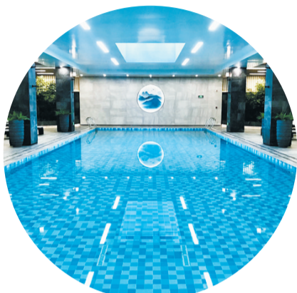
小区内的室内泳池。