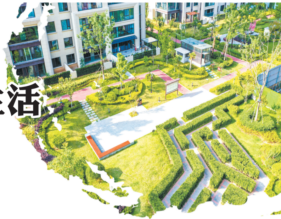
美丽的楼间景观。