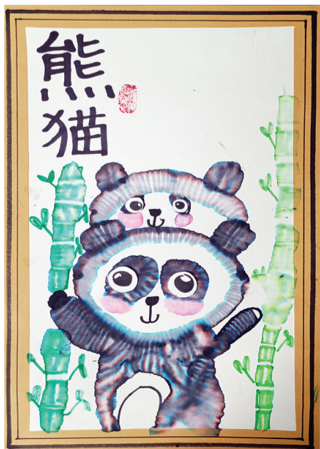
●李陌陌 lx2210083 团结街小学二(二)班

我迫不及待地夹了一块肉放进嘴里,入口即化的肉的香味在我的嘴中蔓延开来。我吃了一块又一块,不一会儿,我的小肚子就变得圆鼓鼓的,这就是我最喜欢的红烧肉。