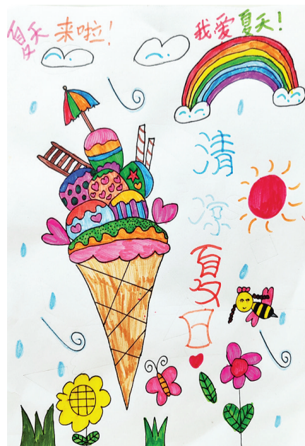
●郑煜晨 lx2210074 塔南路小学二(四)班