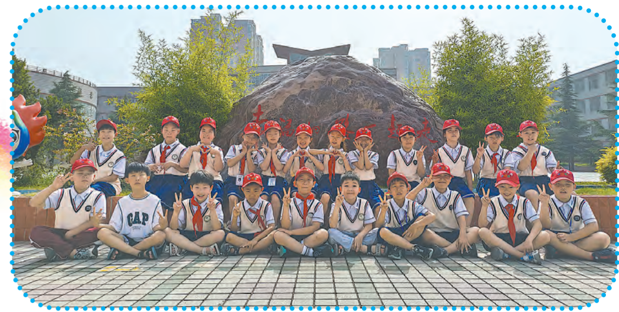
焦东路小学二(14)班小记者合影。

近日，焦东路小学二(14)班开展了“读写绘”活动，让孩子们畅游在书海之中，让美好从孩子们的心灵流淌到纸上，让书香浸润着孩子们的童年。 课堂上，班主任连珂声情并茂地讲述了美国作家埃米·扬的绘本作品：《大脚丫跳芭蕾舞》的故事，故事的主人公琳娜在遭遇困难时仍然坚守梦想、不断努力，最终梦想成真，让孩子们深受启发。 瞧，孩子们利用周末时间进行绘画，并写出了自己的想法——