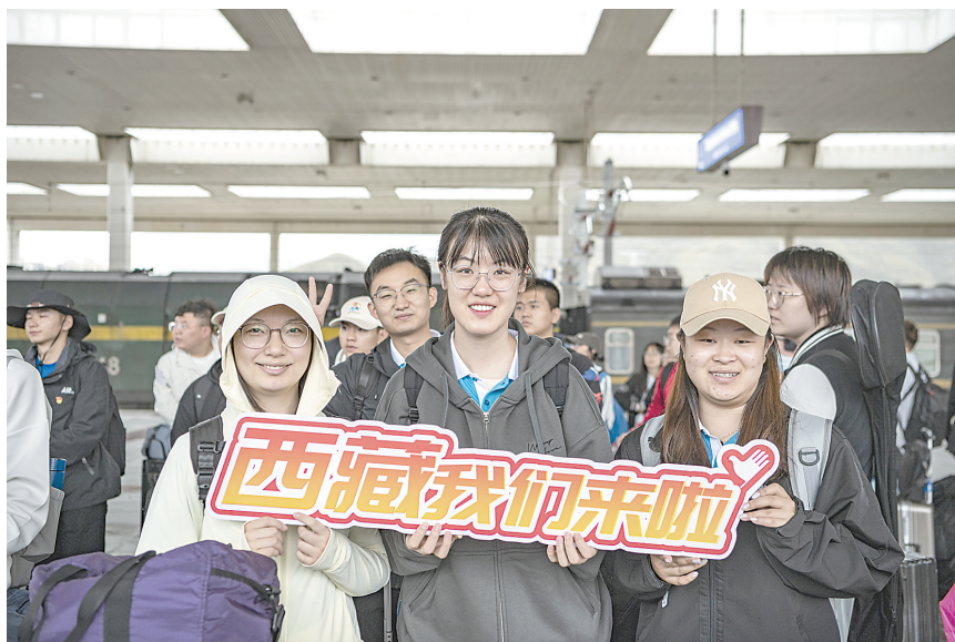
7月24日，在拉萨火车站，志愿者合影留念。当日，来自山西、吉林等地的2023年西部计划西藏专项志愿者陆续抵达拉萨。2023年是大学生志愿服务西部计划实施20周年。据介绍，20年来，共有20批、11751名西部计划志愿者进藏服务。本年度西部计划西藏专项共招募1230人，其中研究生支教团130人。