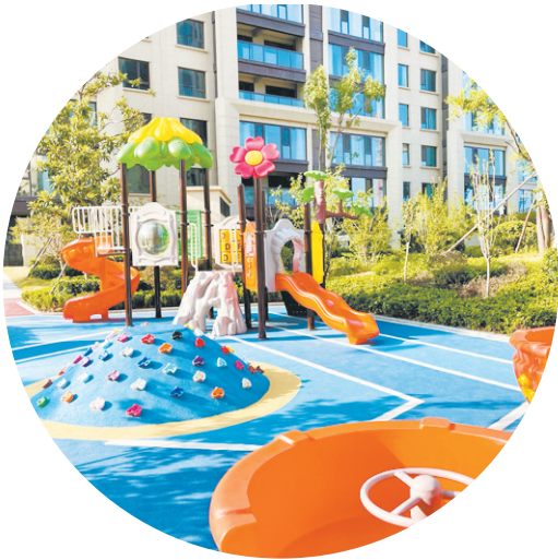
儿童乐园。