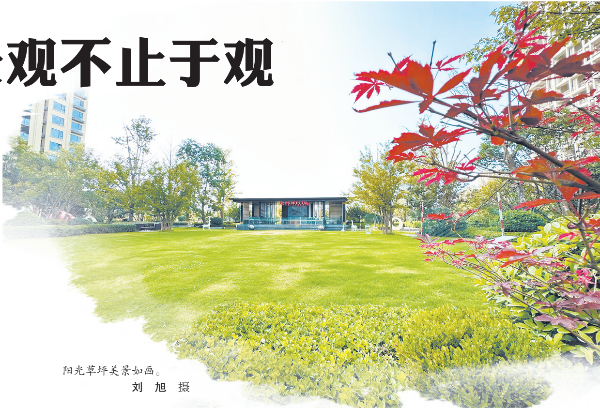
阳光草坪美景如画。

该项目从儿童的特点和需求出发,因地制宜设置儿童乐园、绿色迷宫等活动区,打造具有儿童特色的景观小品,成为亲子互动的绝佳场所。风格既统一又求同存异的宅间花园,通过落叶树种和常绿树种搭配比例协调,营造四季不同的视觉效果,成为业主的“绿色客厅”,业主可以在此社交