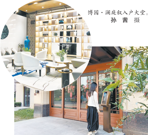
博园·澜庭叙入户大堂。

遇见博园·澜庭叙,邂逅美好生活。刘女士认为,入住博园·澜庭叙之后,发现它比想象中更好,无论是高端大气、样样俱全的入户大堂,还是充满高科技的“可视化门禁”系统,居住在这里,生活真是太便利了。