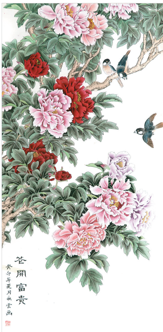
花开富贵 癸卯年夏月秋雲画