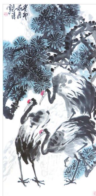
青山秀水(国画) 张意双 作 松鹤图(国画) 刘宏伟 作