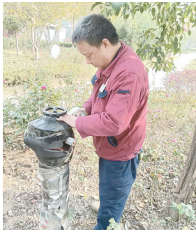
负责人告诉记者。 上图 物业工作人员在给消防栓“穿棉衣”。

近日,记者在金山·东方花园小区看到,工作人员正在用保温棉给消防栓“穿棉衣”。“消防设施很容易被冻坏,为避免发生安全事故时小区消防设施设备无法正常使用,我们提前做好准备工作,为这些消防栓‘穿棉衣’。”该小区物业服务中心