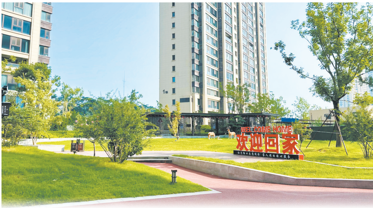
小区内风景如画。

如今的房地产市场，产品看似琳琅满目，实则大同小异，而让产品具有辨识度的正是那些能够提升业主居住体验的小细节。住宅的设计与居住舒适度密切相关，能够在细节之处为业主考虑，让业主在不经意间收获方便，才是真正的好房子。