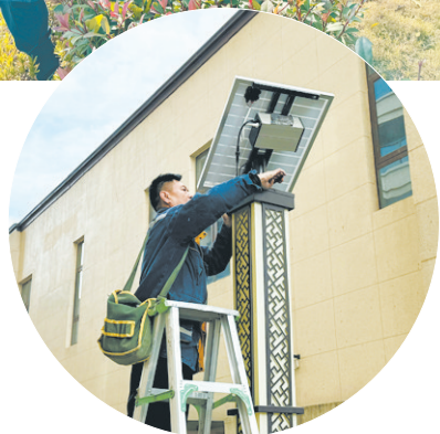
德源物业工作人员在调试太阳能灯。