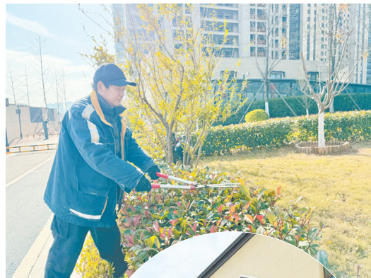
德源物业工作人员在修剪绿植。

一所好房子，是美好生活的开始，而好的物业服务，是幸福生活不断延续的保障。修剪绿植、清扫路面、检查设备、维护治安……德源物业用贴心的服务续写着与业主之间的暖心故事。