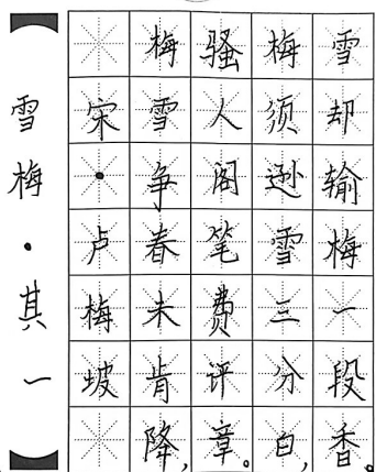
●王玲蕴 fzy2110124 丰泽园小学三(四)班