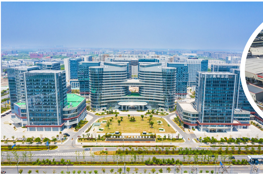
中韩（盐城）产业园未来科技城

新起点、新征程。开发区坚持项目立区，以更高质量建强产业体系。突出“大抓项目、抓大项目”导向，全力攻坚重大项目，推动主导产业强链延链补链，重塑汽车产业优势，打造新能源汽车、晶硅光伏、电子信息三大产业集群，今年实现产业规模重回千亿，打造产业发展“主阵地”。