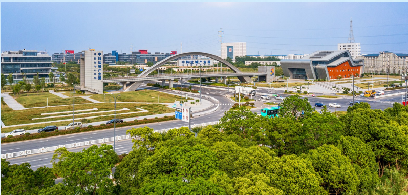
中韩（盐城）产业园友谊桥

8月8日，国家级盐城经济技术开发区迎来三十周岁生日！三十载艰苦创业，三十载栉风沐雨，三十载跨越发展。三十而立，创赢未来！国家级盐城经济技术开发区正意气风发，向着勇当沿海地区高质量发展排头兵目标砥砺前行！