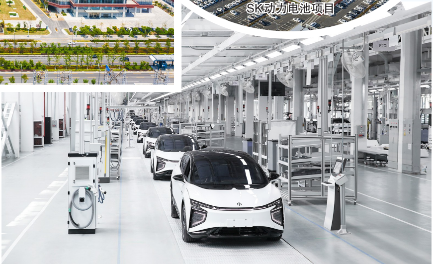
华人运通生产车间

作为关键变量、最大增量，突出企业创新主体地位，以科技创新驱动制造转型。聚焦重点领域关键环节，深化管理机制创新，优化政务服务水平，打造最优营商环境，全面塑造发展新优势，点燃改革创新“强引擎”。