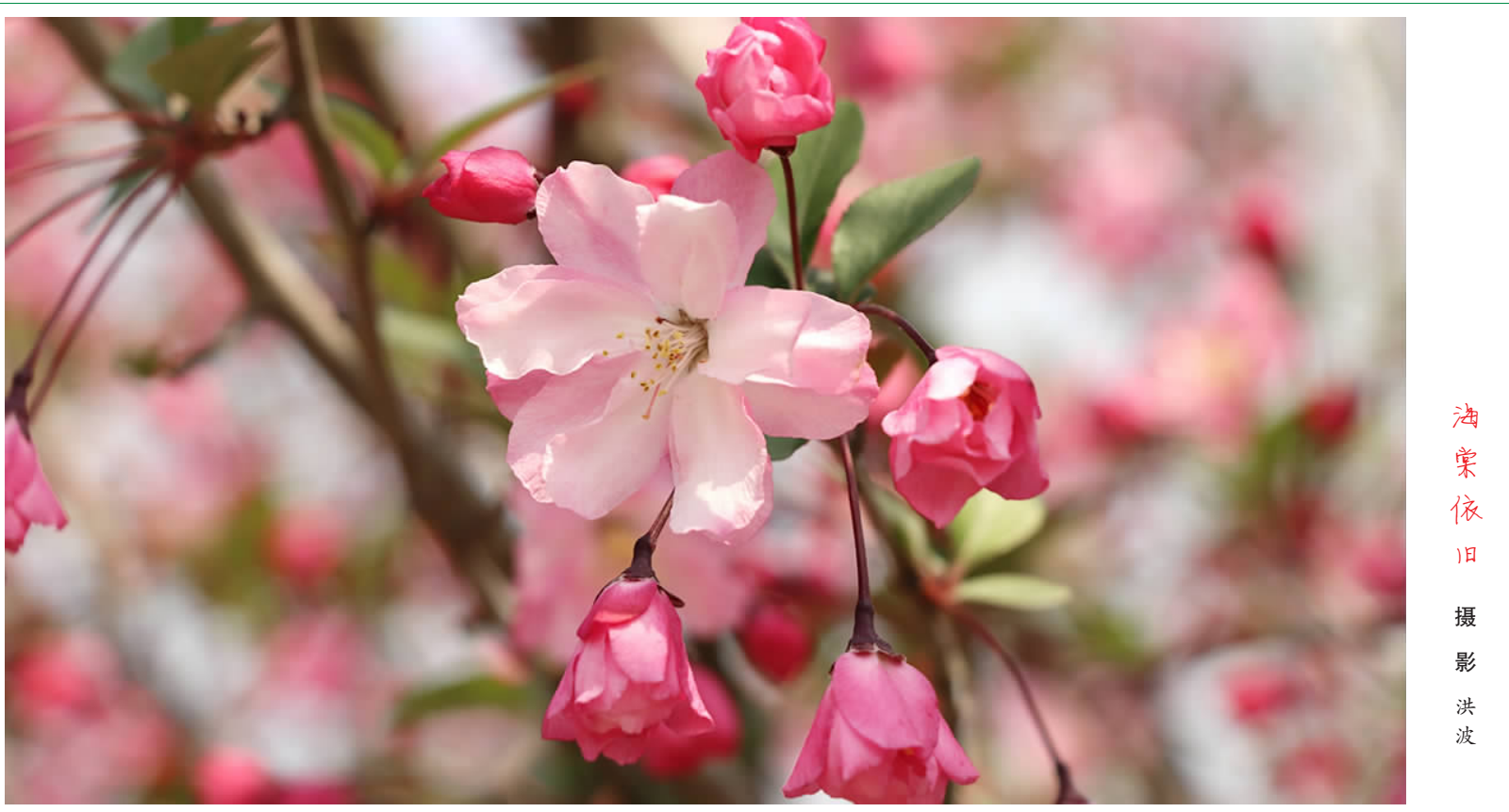
海棠依旧

古往今来,描写春雨的作品很多,光是百度文库收藏文章就达440余万篇,没被收藏的可能更多吧?一年四季,春雨的柔软、夏雨的磅礴、秋雨的萧索、冬雨的冷酷,各有千秋。它们都在扮演着自身的角色。爱与不爱,皆存于天地之间。存在的,即是合理的。