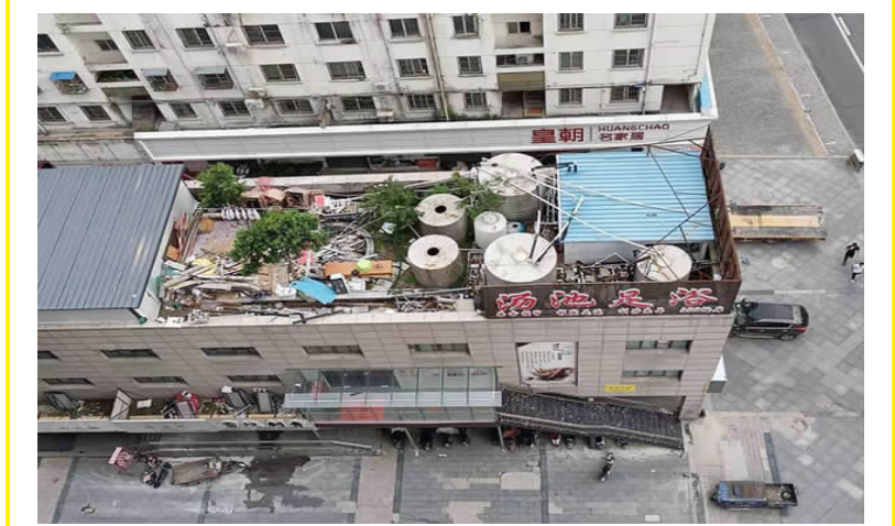
中央城8号楼房顶堆满各种杂物，存在安全隐患。