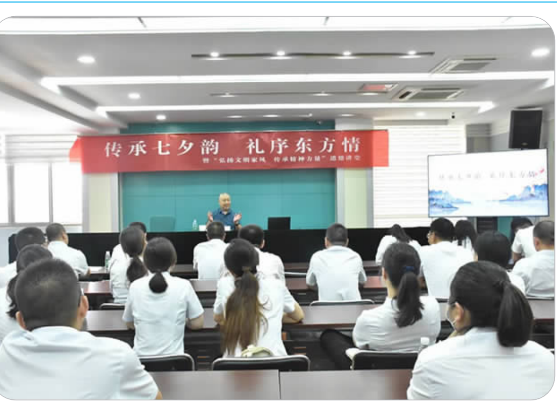
传承七夕韵 礼序东方情