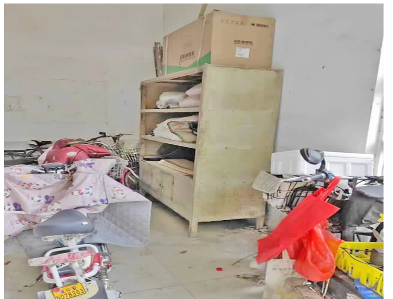
中央城安置小区17幢二单元楼道口堆满杂物,存在一定安全隐患。