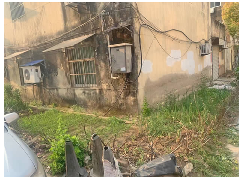
在炎黄大道好多超市后面,有居民毁种蔬菜。