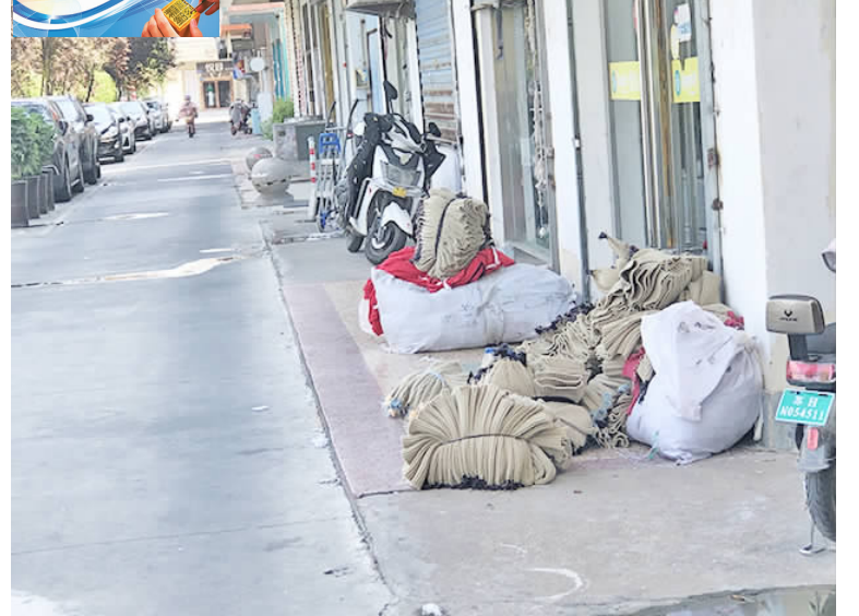
涟东东湖路段有商家在门口乱堆放物品,影响市容市貌。