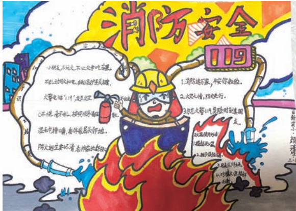
上海市日新实验小学 颜瑾煌 三(1)班 消防安全，人人有责。