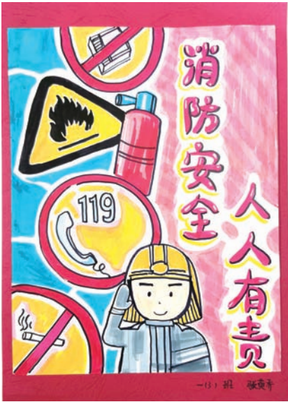
闵行区莘庄镇小学 张萸乔 一(3)班 我们应该从小事做起，不玩火，不吸烟，同时提醒身边的人在公共场所不要吸烟；遇到火灾要临危不乱，正确使用身边的消防用具，学会使用119消防电话寻求帮助，消防安全，人人有责！