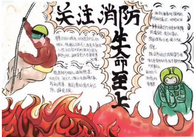
七宝第二中学 张羽彤 六(1)班 火自古以来就被奉为神，是古代人类进步的重要标志。火与我们的生活息息相关，但它也是最容易伤害我们的东西之一。在中国，每年都有超过大量的生命和财产因各种火灾而损失，这表明大火的破坏力有多大。因此，学习必要的火灾应急措施和相应的自救措施是非常必要的。