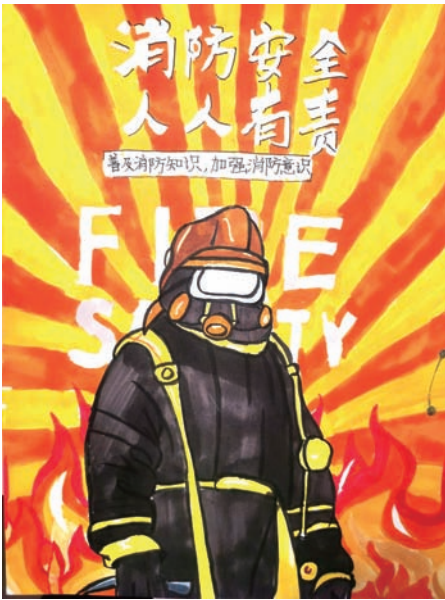
上海市闵行区七宝镇明强小学 钟奕 五(17)班 火灾时有发生，我们要做好以下几方面：(1)要掌握消防知识，一是急救呼叫常识，一旦发生火灾，要立刻报警。二是掌握防火灭火基本常识；(2)应知道火场中如何紧急逃生；(3)积极参加消防演练。