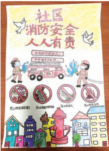
闵行区新梅小学 余苡瑾 四(1)班 社区的消防安全是每个居民的责任。我们的每一分平安，都跟我们日常点滴行为密切相关。居民们多了解一些安全知识，就能多一点保护小区的安全。四种禁止行为：禁止燃放烟花爆竹、禁止在楼道内堆放杂物、禁止乱扔烟头、禁止燃烧杂物，请大家时刻牢记在心！