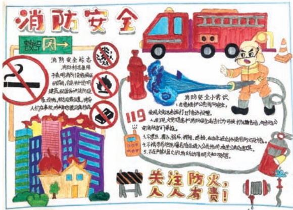
上海市闵行区汽轮科技实验小学 吴思烁 四(4)班 观看完消防安全教育课后，让我对防火安全的印象更加深刻。我知道拨打119时，要说清楚火灾地点、火势大小以及导致着火的原因；认识了许多消防标示牌，还在商场或街道上找到了它们；还学着短片上的小朋友帮助爸爸妈妈寻找家中的火灾隐患，动手制作了一张消防安全小报，爸爸妈妈都夸我是“消防安全小卫士”。