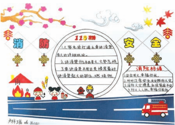
上海市闵行区田园外语实验小学 卢梓瑶 三(12)班 拨打119消防电话应注意：(1)火警电话打通后，要讲清楚着火详细地址；(2)讲清楚什么东西着火，火势怎样；(3)要讲清是平房还是楼房，最好讲清楚起火部位、燃烧物。消防标语：(1)安全用火，幸福你我；(2)时时注意安全，处处预防火灾；(3)消除火灾隐患，永保家庭平安；(4)防火人人抓，幸福你我他。