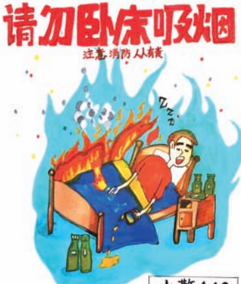
火警119 灾因火起要提防