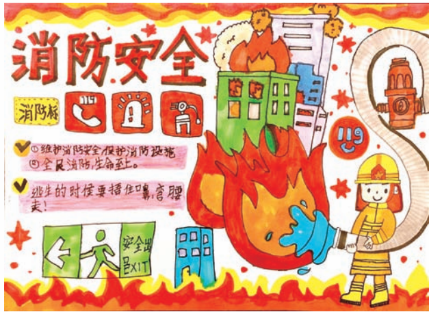
七宝明强小学 章楚 一(15)班 通过该海报宣传“全民消防，生命至上”的意识，强调日常要注重消防设施的安全和维护，学习遇到火情如何逃生和自救的方法。让我们一起“关注消防，关爱生命”！