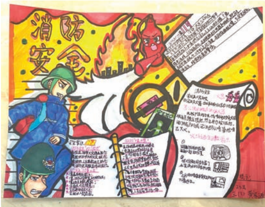
上海莘城学校 黄家源 三(3)班 通过绘画学习消防知识，让大家有了更强的安全意识。将安全教育渗透到日常生活中，为同学们的健康快乐成长创造安全的环境，学会自我保护，安全自救的知识和技能。