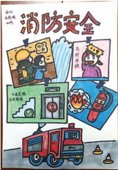
闵行区七宝镇明强小学 毛悦唯 五(3)班 遇到火灾，及时拨打119求救报警，捂住口鼻，弯腰低行，走安全通道，不要乘坐电梯。绷紧消防这根弦，平安健康每一天！