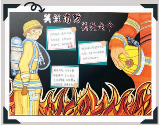
上海外国语大学闵行外国语学校 海睿尼斯 六(7)班 作为一名中学生，我希望通过画笔把更多的消防知识传递给身边的人们，希望大家关注消防安全，也为那些为了我们平安幸福生活而默默付出的逆行英雄们致敬。

为普及校园消防安全知识，提高广大师生火场逃生和自救互救能力，1月19日，闵行区融媒体中心联合闵行区教育局、闵行区消防救援支队，开展公众急救空中课堂“成长学院——你一定要学会的逃生技能”网络直播，课后（消防安全教育“课后”作业）呼吁学生们将所学的消防安全知识传播给身边更多的人，让学生们动手画一画商场、学校、家里等场所的消防安全宣传海报。评选出的优秀作业，将颁发“成长学院优秀学员”证书。