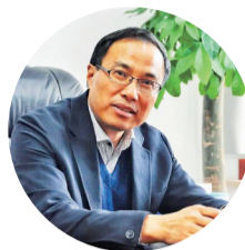
区人社局党组书记、局长 龚惠斌

“十四五”开局之年，闵行又恰逢虹桥国际开放枢纽建设的大好机遇。如何将闵行区人力资源服务业打造成“国家级”，助力上海打造一流营商环境？闵行区人社局将对标中国上海人力资源服务产业园，在虹桥商务区创建国家级人力资源服务产业园。听听闵行区人社局党组书记、局长龚惠斌怎么说——