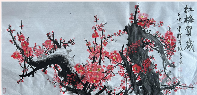
国画《红梅贺岁》 黄振良作