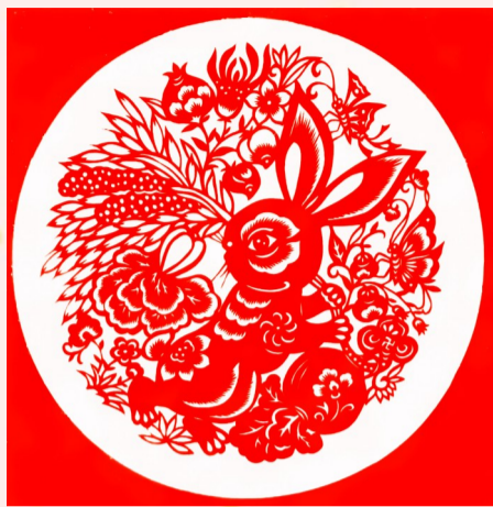
剪纸《兔年大吉》 徐锐/作