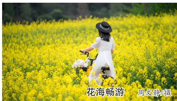
花海畅游