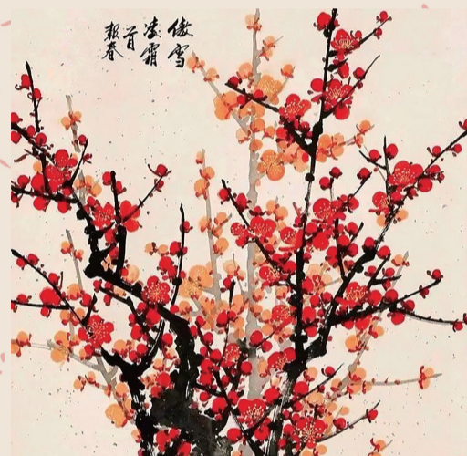
国画《傲雪凌霜首报春》