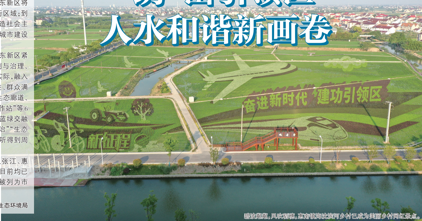
碧波粼粼,风吹稻穗,惠南镇海沈滨河乡村已成为美丽乡村网红景点。