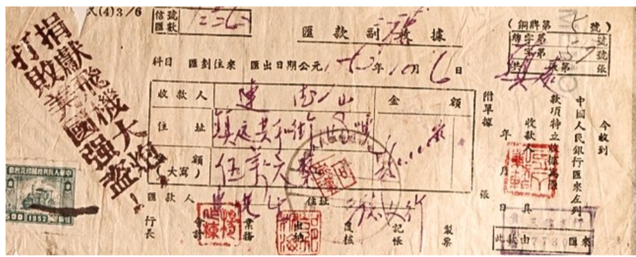
当时市民汇款收据。

1951年10月17日，南汇县各界人民纪念中国人民志愿军出国作战一周年。据统计，全县提前完成捐献4架战斗机的计划，共捐献旧人民币45亿元。