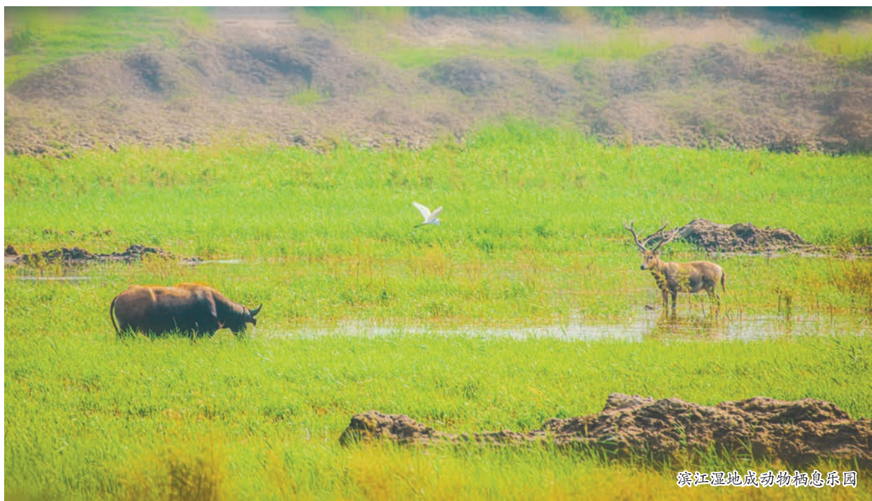
滨江湿地成动物栖息乐园