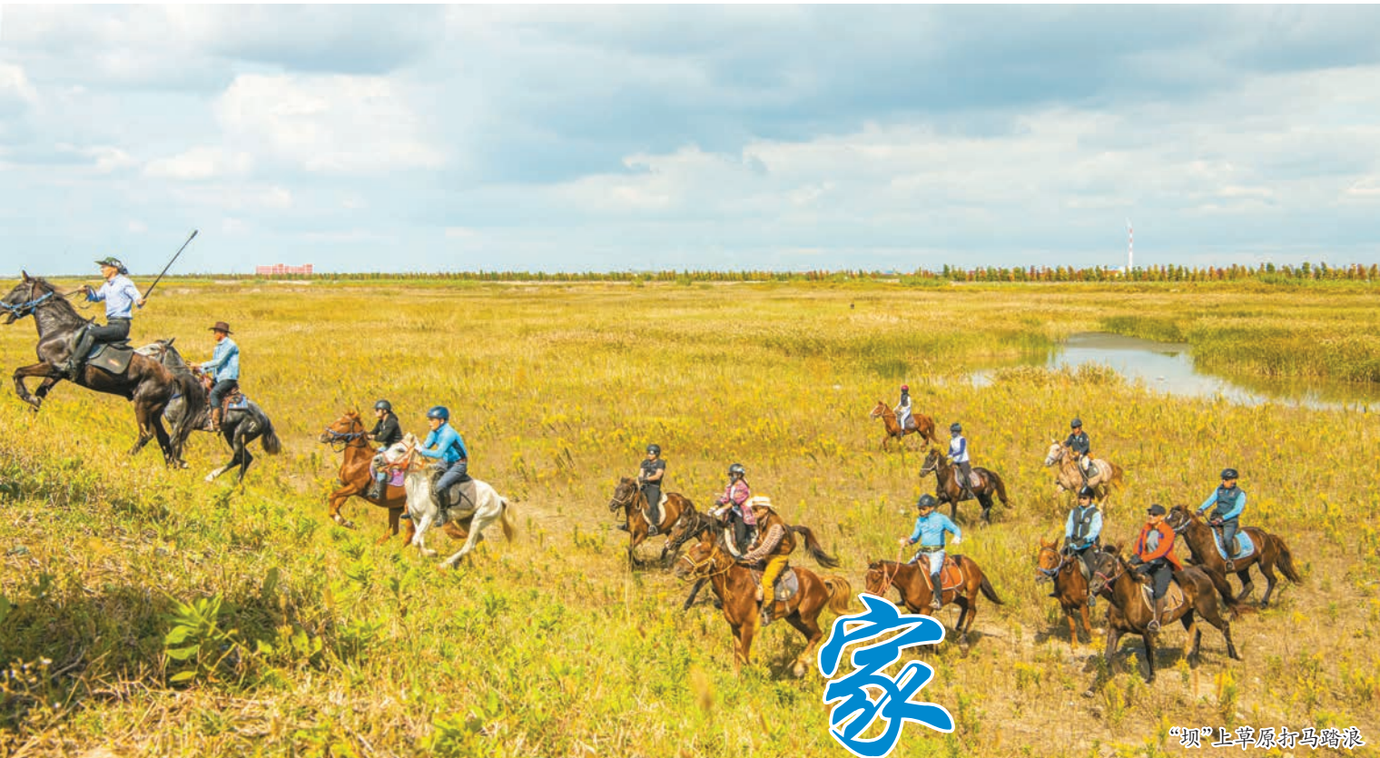
“坝”上草原打马踏浪