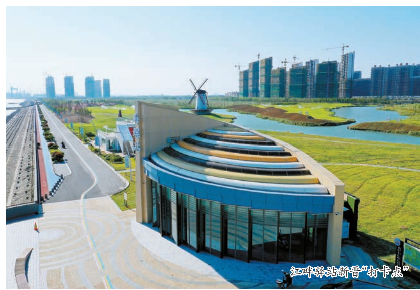
江畔驿站新晋“打卡点”