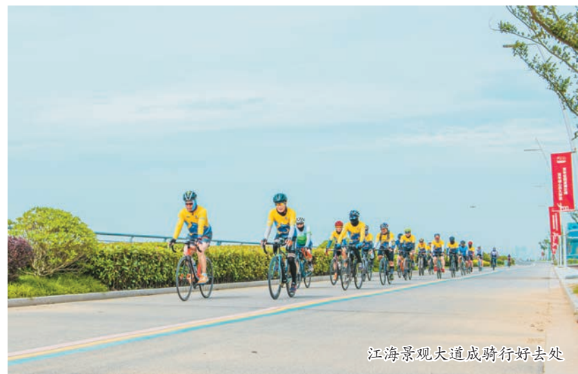
江海景观大道成骑行好去处