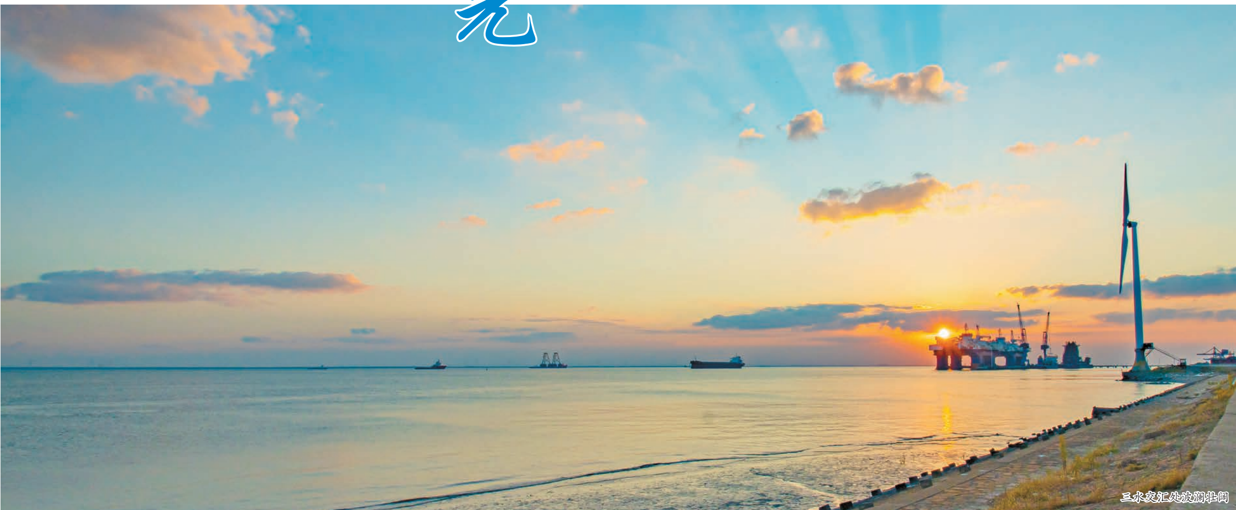
三水交汇处波澜壮阔