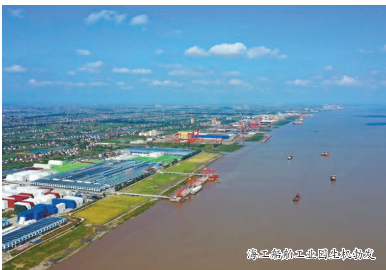
海工船舶工业园生机勃勃