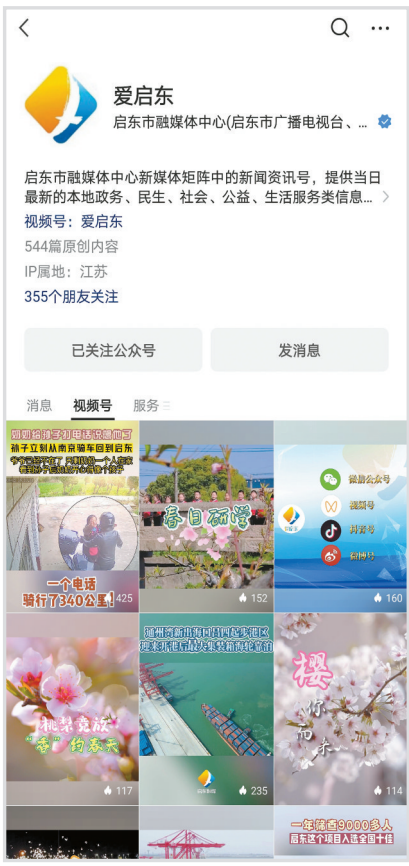
爱启东 微信视频号