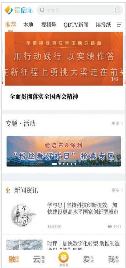
爱启东 移动客户端