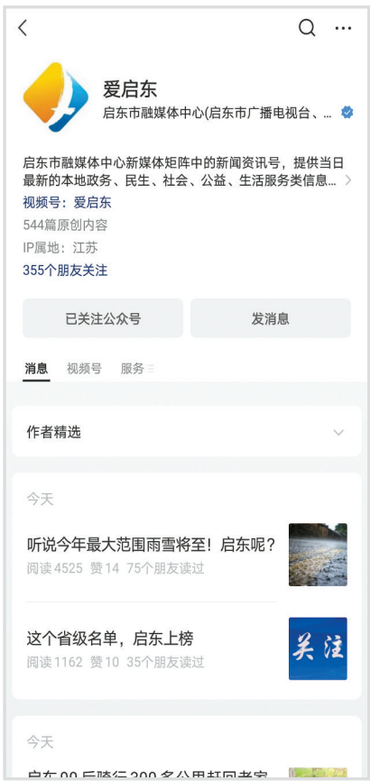
爱启东 微信公众号