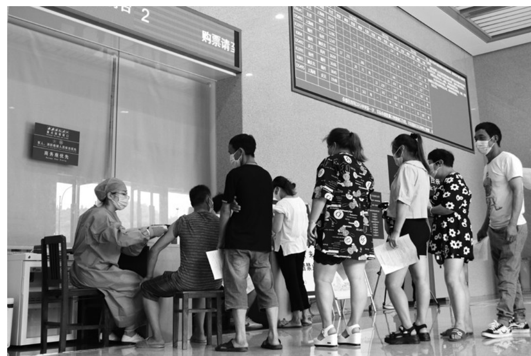
日前,县“流动医院”开进遂昌火车站,在售票厅开设新冠疫苗接种临时点位,为过往旅客提供免费新冠疫苗接种。“流动医院”配备科兴和北京生物两个厂家的疫苗和应有的设备药品。如若接种后出现不良反应,医护人员也能现场及时处理。

据悉,石练镇男子篮球邀请赛至今已举办十届,现已发展为全县规模最大、参赛人数最多、参赛面最广的乡镇民间篮球比赛,也成为篮球爱好者展示自我的“大舞台”。本次邀请赛为期17天,来自县内外共20支参赛队伍参加。