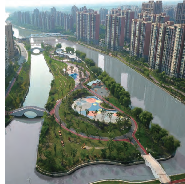
环城水系公园·长岛公园