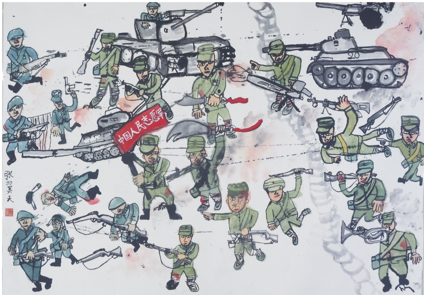
《保家卫国》 区青少年活动中心 张翼天 指导老师：倪俊