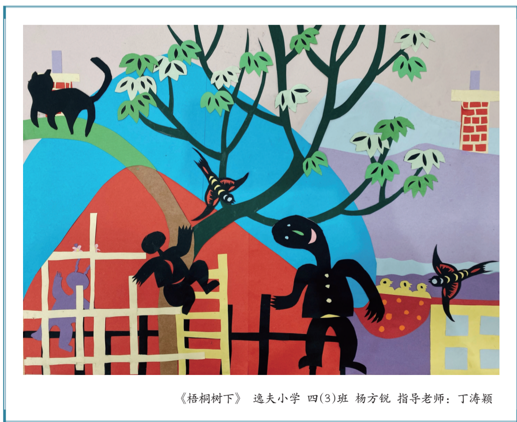
《梧桐树下》 逸夫小学 四(3)班 杨方锐 指导老师：丁涛颖