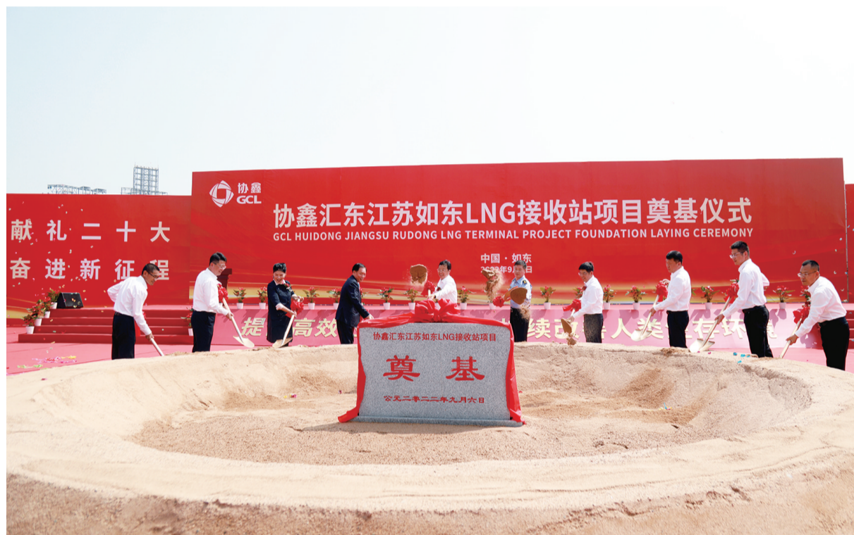
奠基现场。