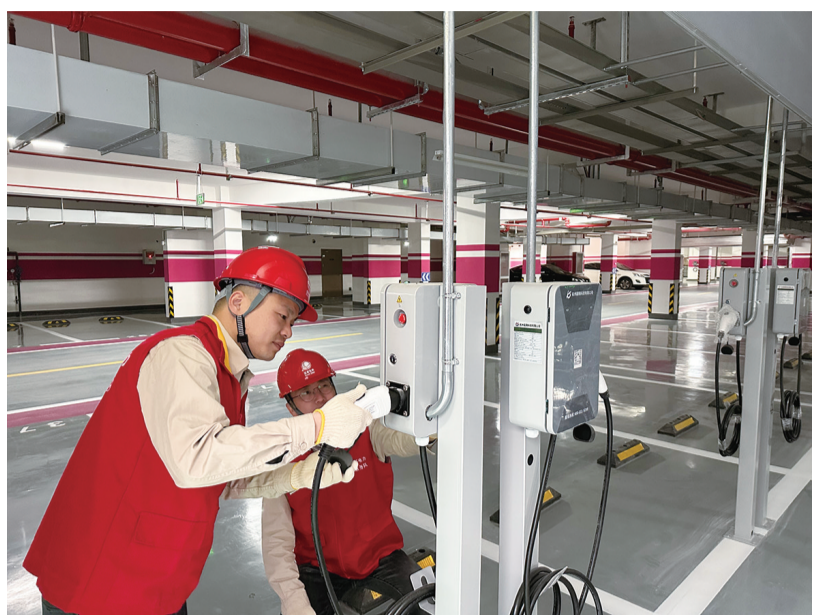
“桩”进小区，便民出行。近日，记者在洋口港经济开发区亲亲家园小区地下车库内看到，该新建小区295个私人车位的充电桩配套设施已全部建成。