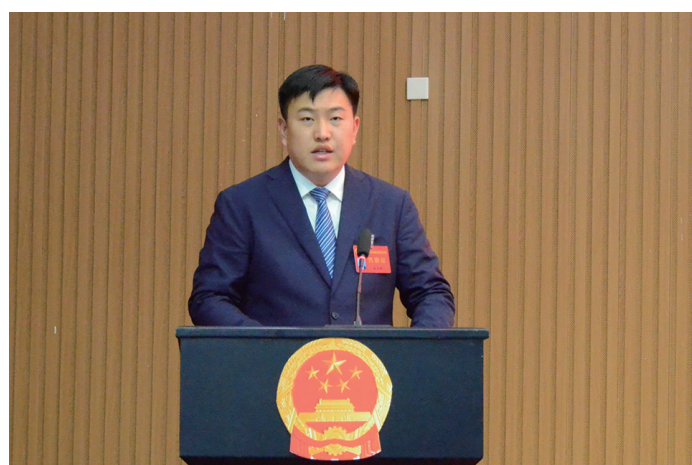
孙玉来作政府工作报告