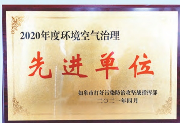
2020年度环境空气治理先进单位