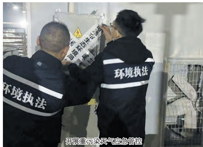
开展重污染天气应急管理

确定处置流程。 按照规定，产废企业与危废处置单位要签订废液处置合同，全部签订完毕后，由南通市如皋生态环境局申报危废处置计划并开具转移联单，由危废处置单位统一收集处置。截至目前，全市共99家企业报名参与代处置。南通市如皋生态环境局从企业在线设备台数、废液产生量以及安装年限等因素综合考虑，在公开、公正、透明原则的基础上，与危废处置单位核定最终收集处置价格，交付企业签订处置合同。