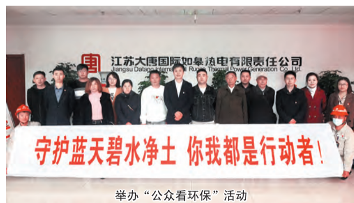
守护蓝天碧水净土 你我都是行动者！

家，占持证单位的三分之一。 加快“三线一单”落地落实。 开展“三线一单”分区管控实施方案编制工作，根据新一轮国土空间规划，全面梳理全市各级工业园区，对不符合空间规划的园区，不再纳入“三线一单”重点管控单元。