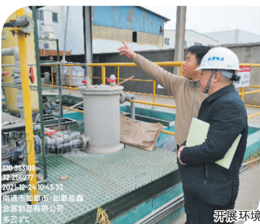
开展环境执法行动