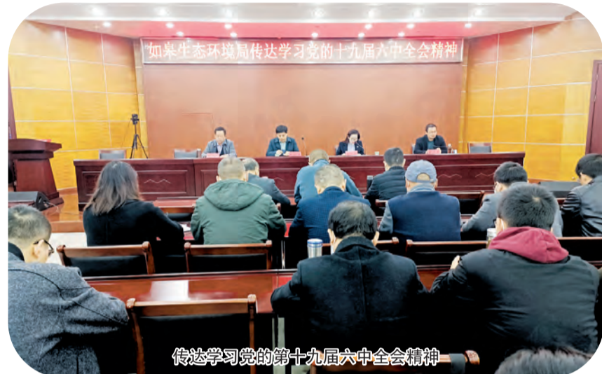
传达学习党的十九届六中全会精神