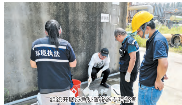
组织开展应急处置设施专项督查

稳步推进土壤固废整治。 开展土壤污染防治专项审计，推动重点地块土壤污染状况调查；督促64家重点监管单位开展土壤污染隐患排查、土壤和地下水自行监测等工作。深入开展危废安全专项整治和危废处置企业危化品使用专项治理，推动危废仓库审批监管缺口问题整改，全市201家企业危险废物仓库的分类处置工作已全部完成。制定《如皋市分散农村生活污水处理设施建设与运维规程（试行）》，委托有资质单位对全市日处理能力20吨及以上的农村生活污水处理设施的水质进行监测。