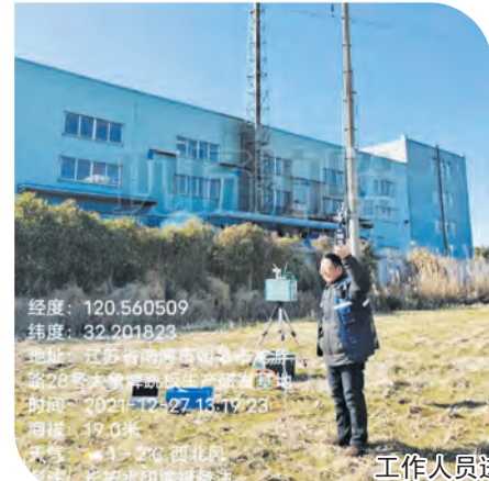
经纬度：120.560509 32.201823 地址：江苏省南通市如皋市... 电话：021-12-2741-1123 海拔：19.0米 气压：1.2% 西北风 风速：1.5米/秒 偏南转北