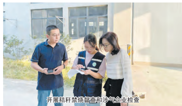
开展秸秆禁烧督查和涉气企业检查

环境信访逐步压降。 规范办理流程，严格按照“联系办理、调查核实、反馈回访、跟踪督查”四步