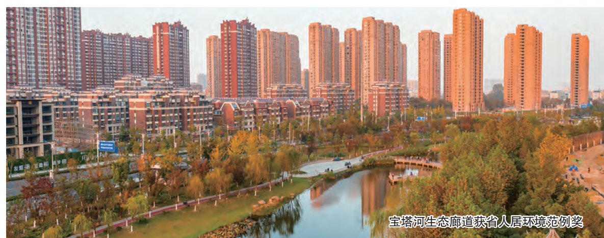
宝塔河生态廊道获省人居环境范例奖