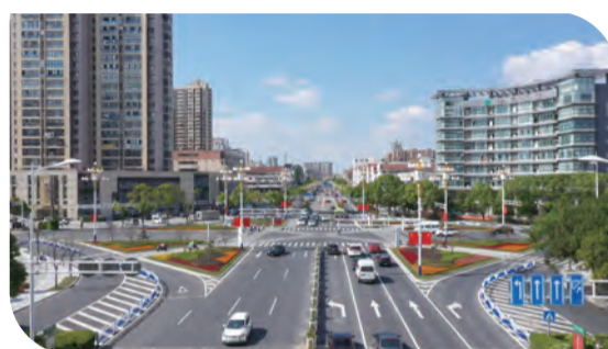
福寿路海阳路交叉口渠化改造

台，在南通市中率先开展瓶装液化石油气统一配送，121辆专用车辆已投入运行，进一步保障配送安全和用气安全。建筑施工安全监管力度持续加大，全年开展日常巡查642次，发现安全隐患4212条，开具安全隐患整改通知书582份，停工（局部）整改通知书60份。城市地下管网监管和市政工程安全监管整体平稳。