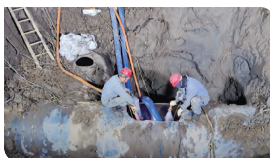
供水三期对接现场