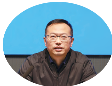
市住建局党组书记、局长 姜强

新的一年，市住建局将围绕“高质量建设美丽宜居城市，致力打造生态宜居样板区”目标定位，重点突出“国家生态园林城市创建和申报国家历史文化名城”两个抓手，全力推进建筑产业转型升级、房地产市场平稳发展、城市品质提升、历史文化名城保护利用、住房保障综合提升、城乡统筹发展、安全生产专项整治等八项重点工作，为奋力谱写如皋现代化建设新篇章贡献建建力量。