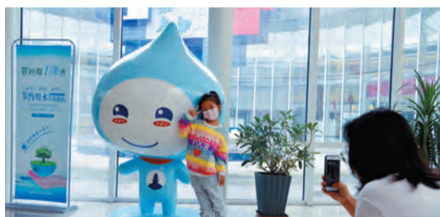
如皋高速服务区成功创建为“江苏省节水型高速公路服务区”