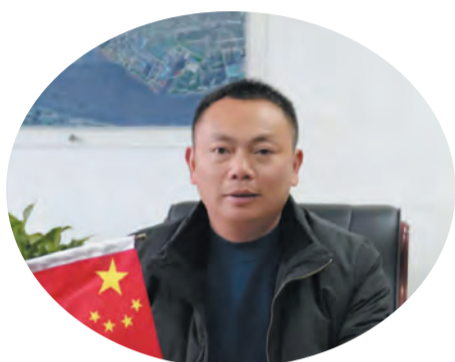
市水务局党组书记、局长 朱建军

立足新起点，启航新征程。2022年，市水务局将继续发扬治沙精神，始终同人民想在一起、干在一起，风雨同舟、同甘共苦，真抓实干、善作善成，加快推进片区河道治理，提升生态河道覆盖率，做好“自己的河道自己管护”，实施“万户总动员、清流绕万家”幸福河湖建设行动，为“水美如皋”建设提供持续动力。