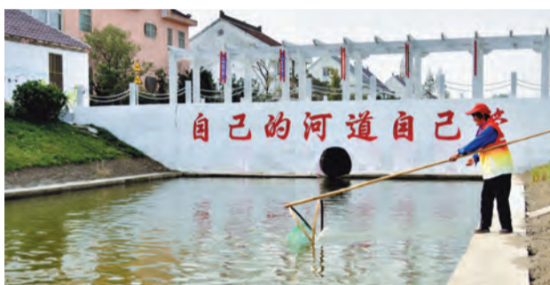
推行“自己的河道自己管护”