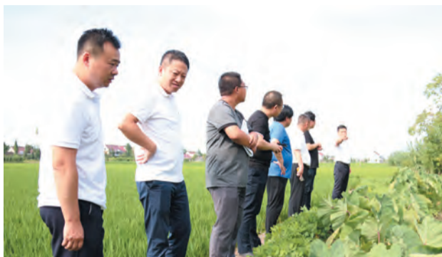
市领导实地调研水环境治理情况

度”，完成年度“互联网+监管”行政检查行为数据上报，全面开展矛盾纠纷排查，消除不安定因素。强化水利安全生产监管。完善6座桥梁的标志标识，对两座通航桥设置防撞设施，保证通航船只的安全。截止目前，督查水利工程运行各类问题隐患均已整改完成。