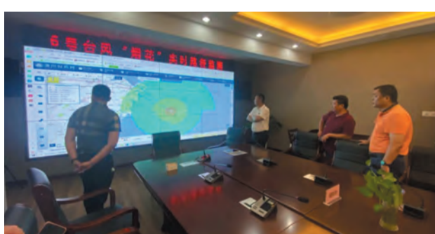
做好水旱灾害防御