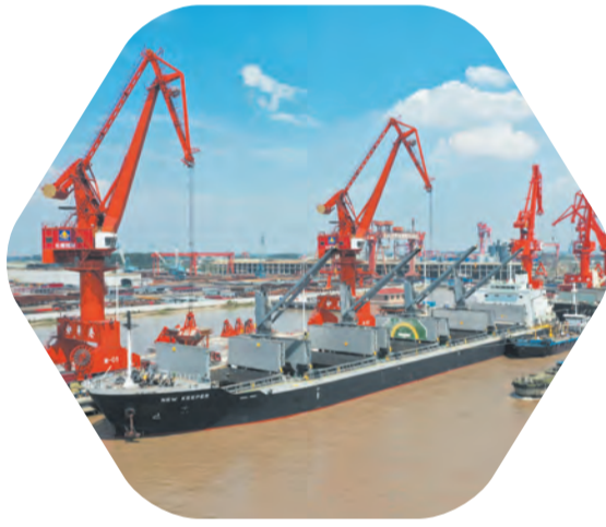
外轮靠泊长源码头