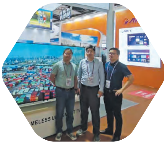
组织企业参加130届广交会线下展