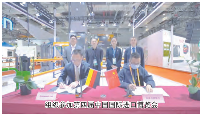
组织参加第四届中国国际进口博览会