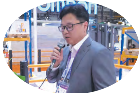
市商务局（口岸办）党组书记、局长 市投资服务中心主任，市招商局局长 余飞