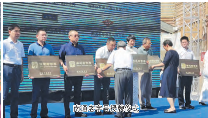
南通老字号授牌仪式