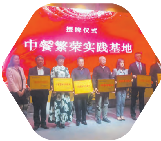
如皋三家老字号被评为南通中餐繁荣实践基地

2022年，市商务局将进一步坚定发展信心，把握形势、抢抓机遇，主动融入长三角一体化，持续提升对外开放水平，着力提高利用外资质量、积极转变外贸增长方式、不断提高对外经济合作层次能级，加快构建新时代下如皋特色开放型经济体制机制，为如皋高质量建设跨江融合发展样板区提供有力支撑。