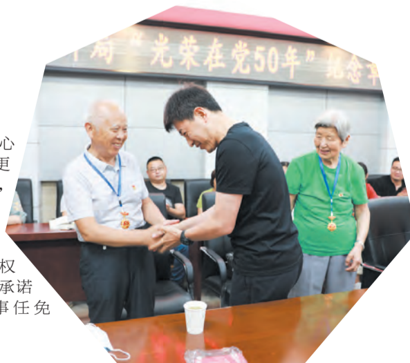
给离退休干部颁发“光荣在党50年”纪念章

理现代化指挥中心相关工作，及时更新12345知识库，定期参加巡河护河活动，加快部门社会信用体系建设，对照行政权力严格执行信用承诺制度，用好人事任免“一票否决”权。