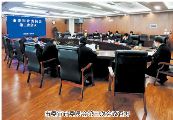
市委审计委员会第三次会议召开