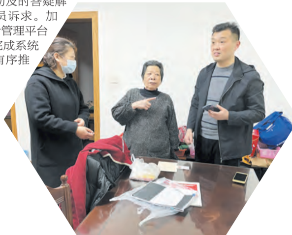
上门核对养老金发放情况

立和完善规范性制度9项。通过数据分析与现场核查相结合开展社会保险基金审计，重点关注应保未保、异地重复保以及死亡继续享受等群众关注高问题，确保全市社会保险基金积极健康运行。对居家养老服务2018年至2020年资金管理使用情况专项审计调查，重点关注村（社区）居家养老中心建设补助资金使用和政府购买服务两个方面，采取现场入户与电话核查相结合的方式，对服务时长、服务内容、服务范围、资金保障等方面开展群众满意度调查。