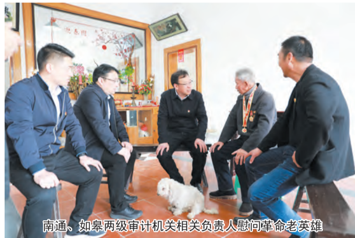
南通、如皋两级审计机关相关负责人慰问革命老英雄