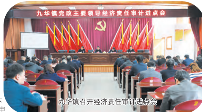
九华镇召开经济责任审计进点会

结果实行全过程公开；高度重视退休人员的依申请公开和信访件，与多部门联动及时答疑解惑、回应相关人员诉求。加快数字化工程审计管理平台等保测评工作，完成系统二级等保申报，有序推进系统安全测评。