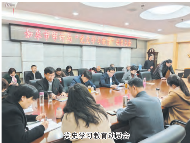
党史学习教育动员会