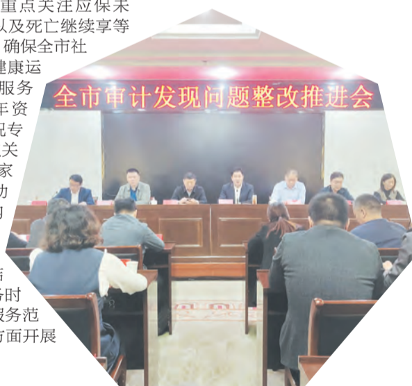
全市审计发现问题整改推进会