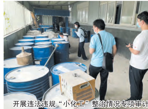
开展违法违规“小化工”整治情况专项审计