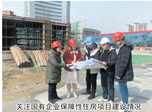
关注国有企业保障性住房项目建设情况