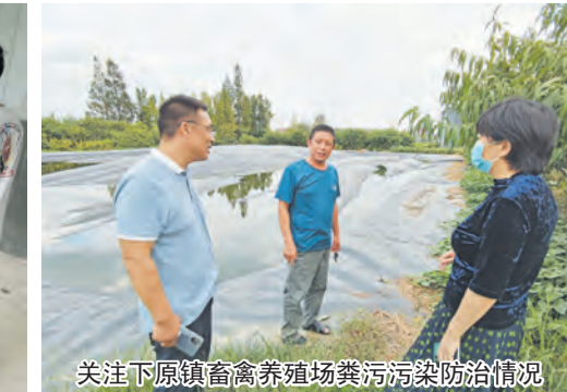
关注下原镇畜禽养殖场粪污污染防治情况