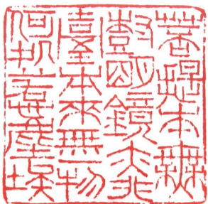
菩提本无树 明镜亦非台 本来无一物 何处惹尘埃 唐·惠能句