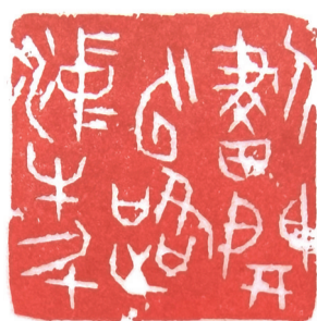
划开云路冲牛斗 宋·李春叟句