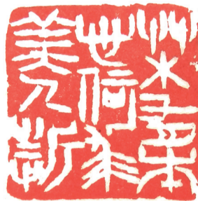
草木有本心 何求美人折 唐·张九龄句

暮年紅紫夢 醉後意南園 嚼嘗騎鯨 釀得淋漓 夢中出 錦繡 成 新 妙 妙 妙 妙 妙 妙 尺 咫 兩 雷 未 須 憑 信 不 工 朱庸齋先生詞法不學 題唐詩 文化公園 四亭 名花 齊 盛 會 壬寅 年 月 初 七 梁 基 永 書 於 羊 樓 甫 畔 四 亭 小 齋