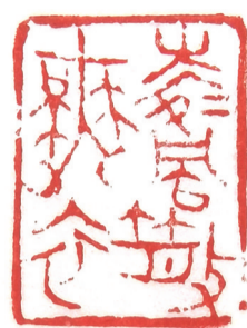
凌风散舞衣 南朝·刘琨句