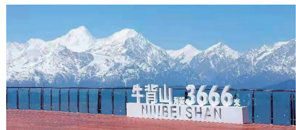
牛背山景区观景平台

一流景区投资、开发、运营龙头企业的练兵场、主阵地、主战场。”四川能投集团领导表示,集团高度重视标杆项目打造。四川能投集团相关领