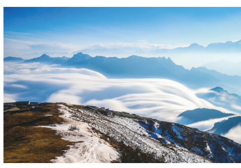
牛背山山顶云瀑奇观